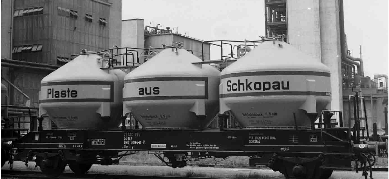
Kesselwagen mit Anlage, Bau I 104 (NDPE Niederdruckpolyäthylen-Anlage), 8. Juli 1977 (LASA, I 529, FS Nr. FN 59631)

Dienstreise- und Jahresberichte enthalten Informationen über zahlreiche Betriebe, zu denen teilweise kaum noch weitere schriftliche Überlieferung existiert. Die VVB-Bestände sind bislang nur zum Teil für die Benutzung erschlossen.