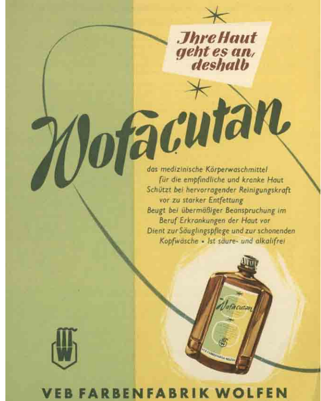
Produktzettel für Wofacutan, ohne Datum (LASA, I 509, Nr. D 1220)

Der Bestand I 525 Leuna-Werke verfügt über Schriftgut aus nahezu allen Bereichen eines chemischen Großbetriebes in der DDR. Hier wären unter anderem