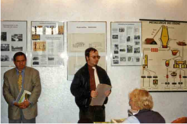
Gemeinsame Ausstellung Deutsches Chemiemuseum Merseburg und Stadtarchiv Leuna zum Jahr der Chemie 2003 (StA Leuna, Lichtbildsammlung, Nr. 3282).

chemischen Industrie mittels Einlagerungen in den Jahresringen von Bäumen.