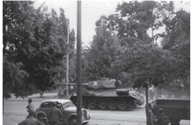
Fotografie eines sowjetischen Panzers auf der Hallischen bzw. Halberstädter Straße in Magdeburg, 17. Juni 1953

Dabei werden die Art und Weise des Protests, die Forderungen sowie die Reaktionen des Regimes und des sowjetischen Militärs behandelt.